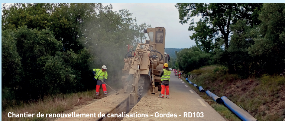
Chantier de renouvellement de canalisations - Gordes - RD103